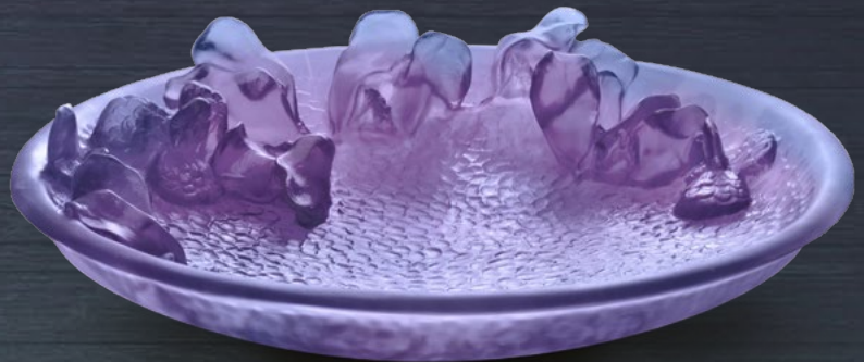
Coupe Jardin Imaginaire violet bleu H : 12 cm x L : 30 cm x l : 30 cm

Purple blue Fantasy Garden bowl H: 4 5/7" x L: 11 4/5" x W: 11 4/5"