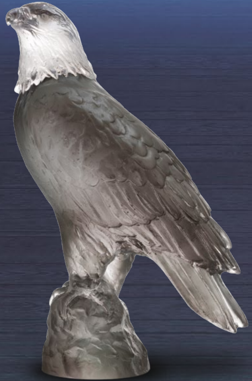
Aigle PM gris