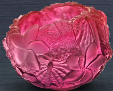
Vase magnum Bouquet arc en ciel Edition limitée à 175 exemplaires H : 34,5 cm x L : 35 cm x l : 37 cm