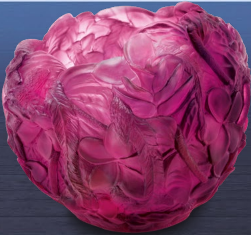
Vase Bouquet rouge violet