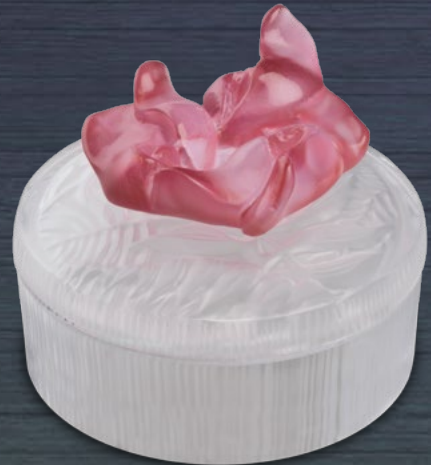
Facon de parfum Jardin Imaginaire parme rose