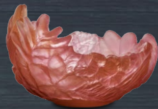
Bougeoir Bouquet rouge orange