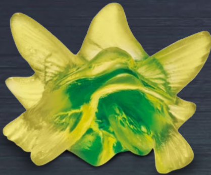
Couple de colibris jaune vert