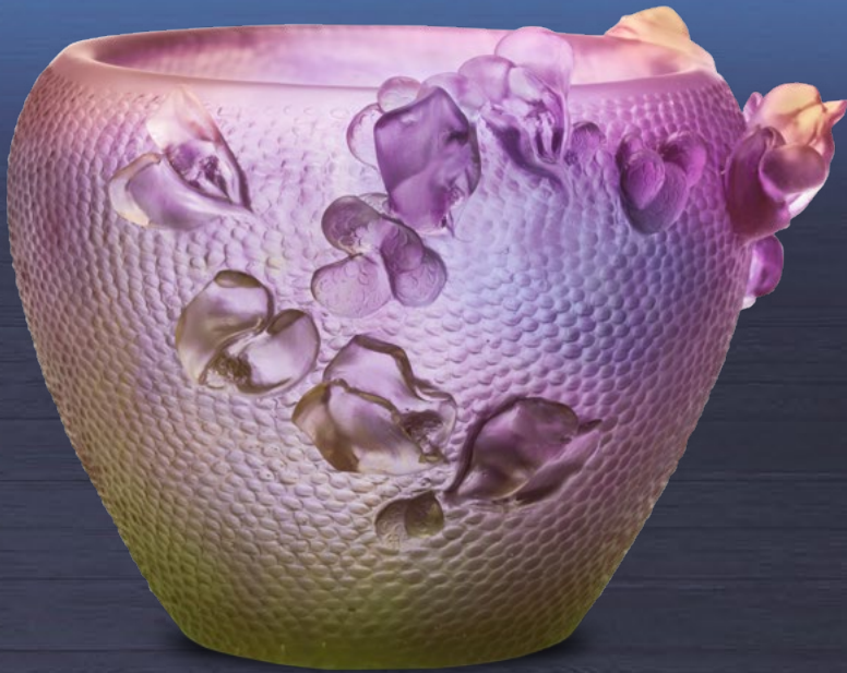
Vase rond Jardin Imaginaire violet vert H : 20 cm x L : 35 cm x l : 35 cm

Purple green Fantasy Garden round vase H: 7 7/8" x L: 13 7/9" x W: 13 7/9"